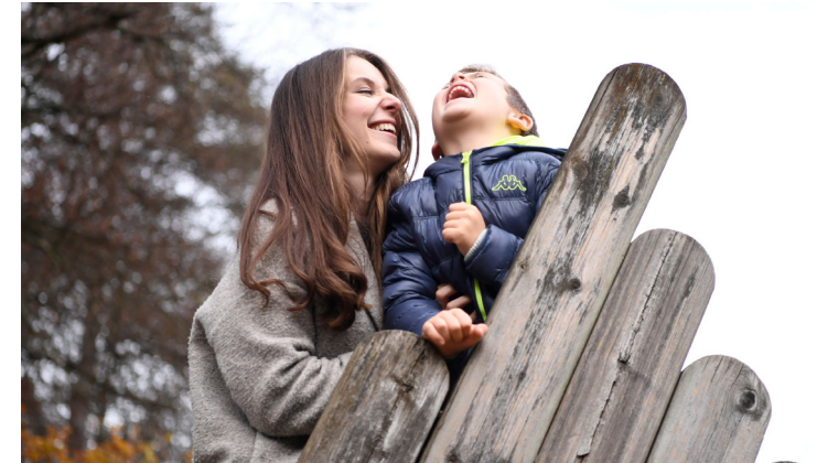
Eine freiwillige Mitarbeiterin von Pro Pallium verbringt Zeit mit einem Geschwisterkind.

Unsere Regionalleiterinnen helfen Familien, sich im komplizierten Versorgungssystem zurechtzufinden. Sie kennen regionale und nationale Angebote und stehen mit Rat und Tat zur Seite. Pro Pallium begleitet die Familie über eine lange Zeit und ist auch nach dem möglichen Tod des Kindes weiter für sie da.